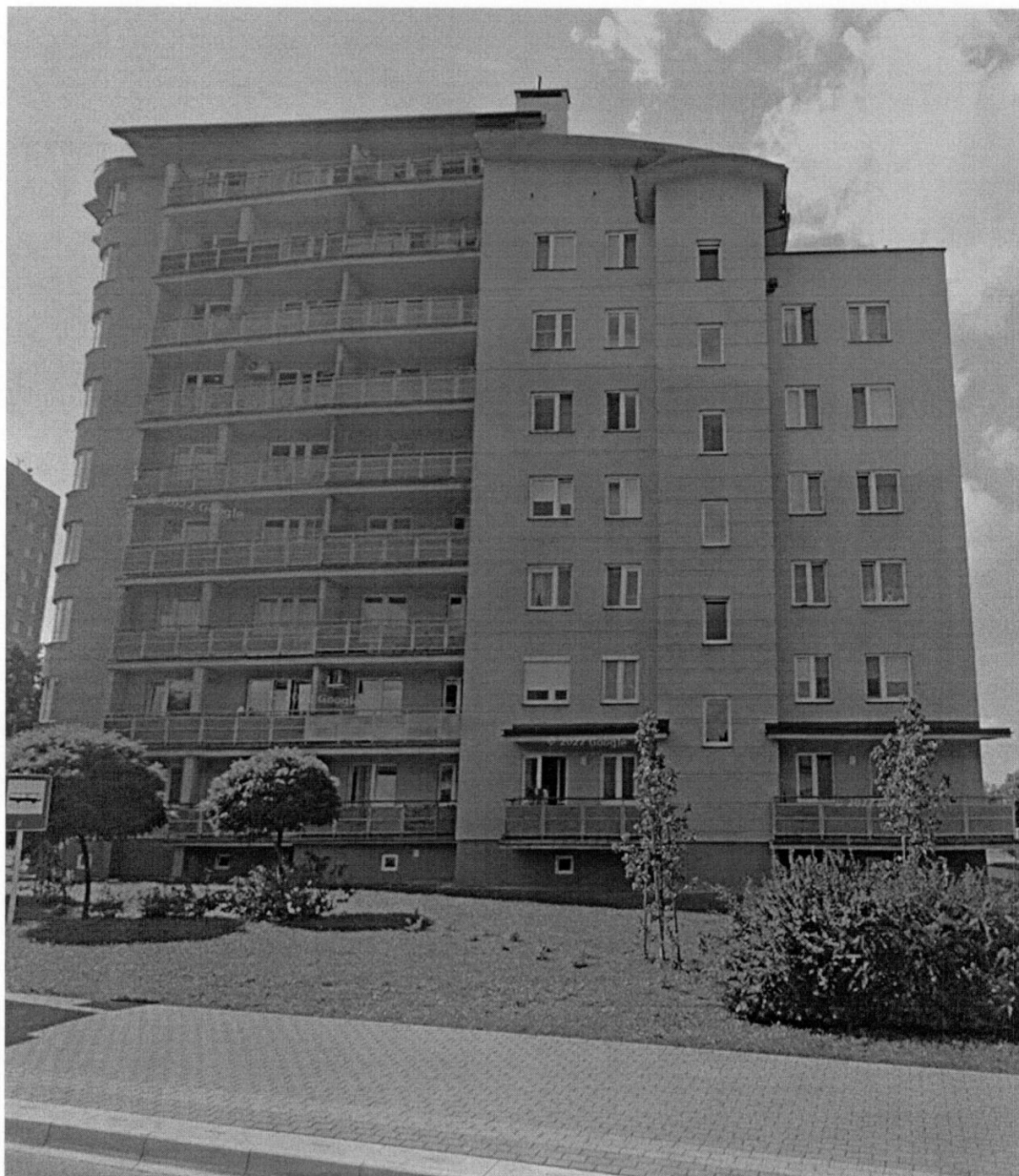
Widok elewacji wschodniej: